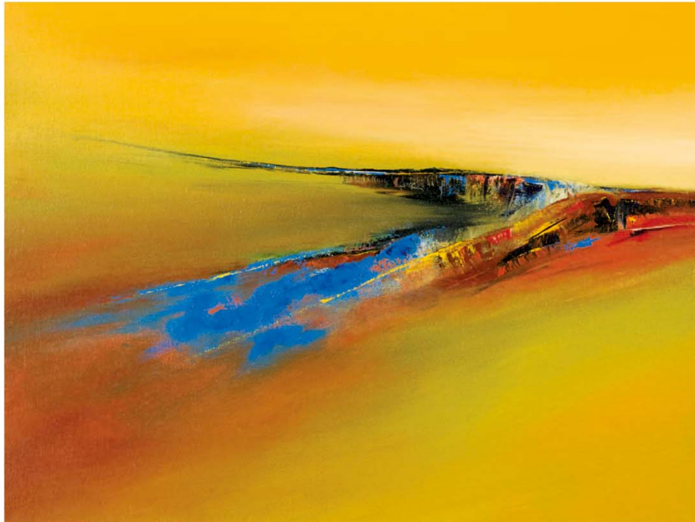
Painted Desert XIII-2007, Acryl auf Jute, 90 x 120 cm

Ideen zu neuen Bildern entstehen oft auf Reisen: Küstenlandschaften und Wüsten bilden einen Schwerpunkt mei-