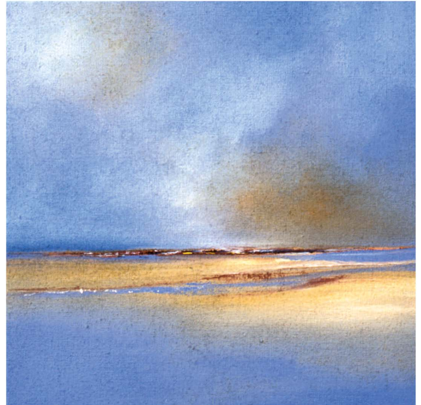
Landschaft XVI-09, 2009, Acryl auf Jute, 60 x 60 cm

ner Arbeit. Und so führten mich meine Reisen vielfach nach Australien und in die USA, aber auch in meiner norddeutschen Heimat greife ich Aspekte von Weite, Licht und Raum auf.